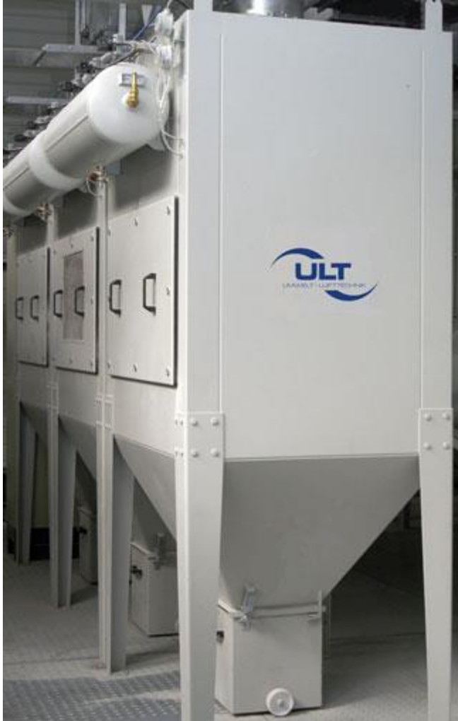
Bild 3: Kompakte Luftreinigungsanlagen der ULT AG in der GFK-Fertigung

feinste Schwebstoffe unter Einsatz von Filtern der HEPA-Klasse (High Efficiency Particulate Airfilter). Die Luft gelangt anschließend wieder in den Arbeitsraum zurück– ein weiteres Plus für den Energiehaushalt. Die Kaskade ist kompakt, weist lange Standzeiten der Filter auf und verbraucht vergleichsweise wenig Energie.