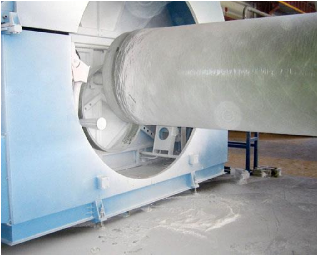
Bilder 1 und 2: Blick in das Arbeitsumfeld vor Erfassung der Stäube