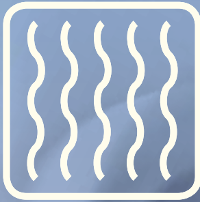
Geruch, Gas und Dampf