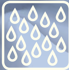
Öl- und Emulsionsnebel