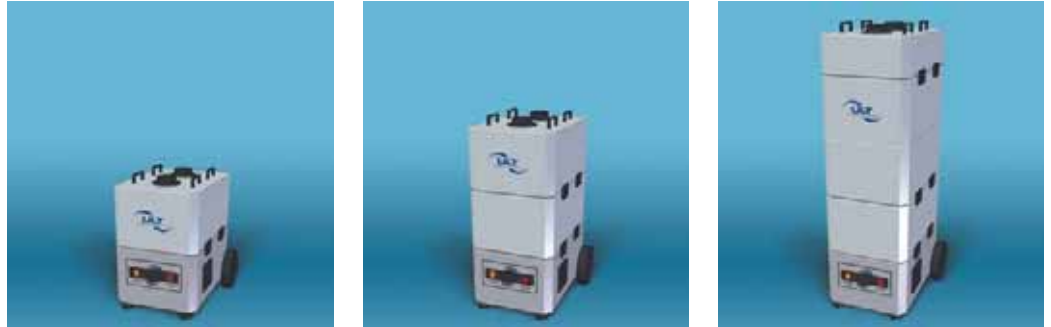
Modifikationen Speicherfiltergeräte ULT 300 Modulsystem

Bei vielen Arbeitsprozessen entstehen Gefahrstoffe in Form von Staub, Rauch oder Gasen. Diese bilden Gefahren für: